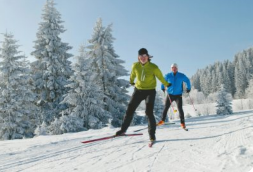
Wintererlebnis im Biosphärenreservat Rhön