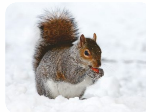
Eichhörnchen bei der Nahrungssuche

Viele Tiere, unter ihnen Fledermäuse, Siebenschläfer, Haselmäuse, halten derzeit Winterschlaf. Andere, wie beispielsweise Dachs und Eichhörnchen, befinden sich in Winterruhe. Stört man sie dabei, laufen sie große Gefahr zu verhungern, denn in dieser Zeit finden sie kaum Nahrung!