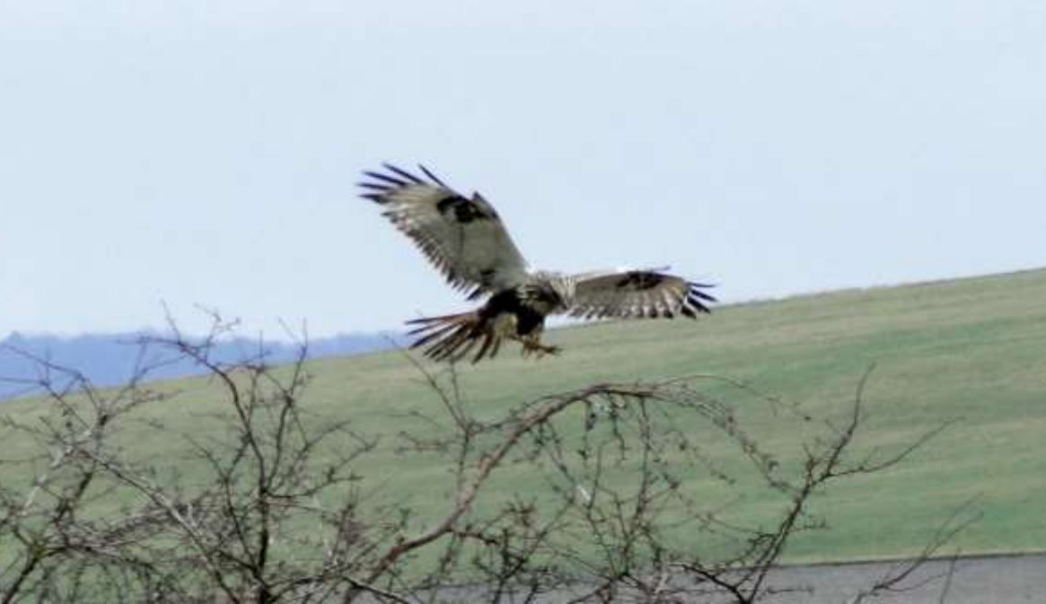
Raufußbussard ( Buteo lagopus )