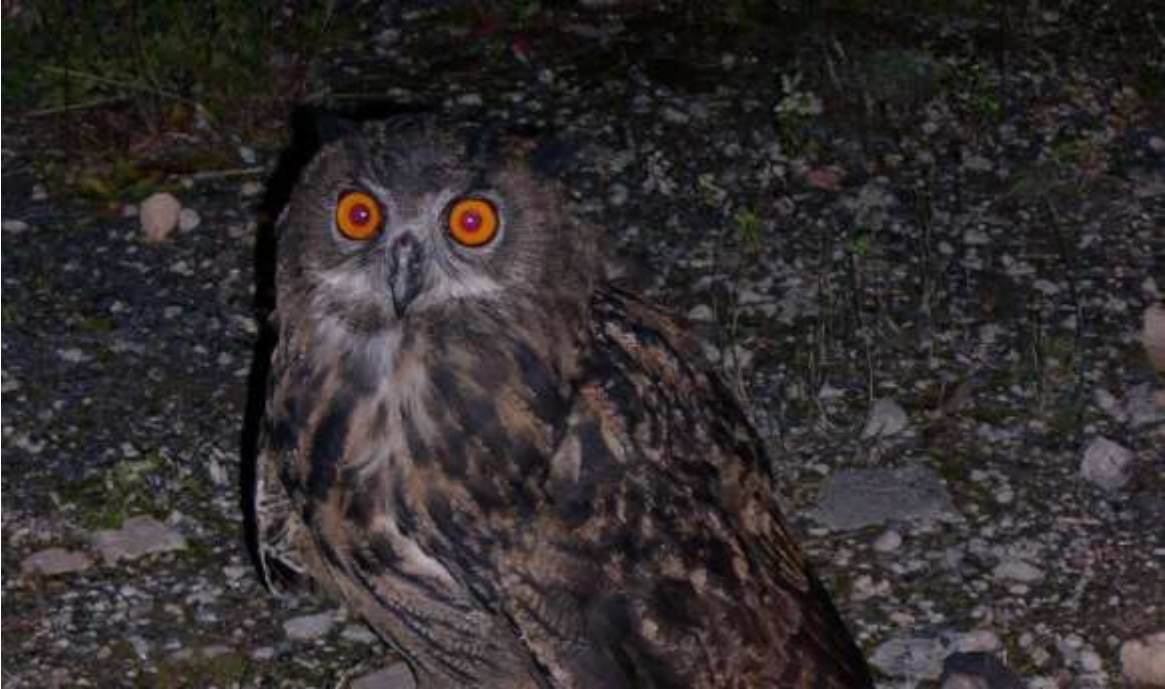
Adulter Uhu (Bubo bubo)