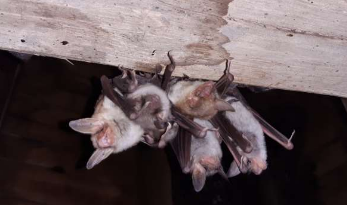
Großes Mausohr ( Myotis myotis )