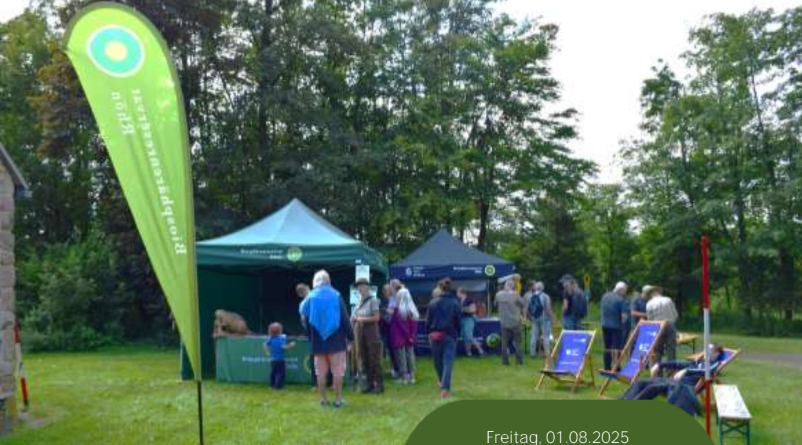
Besucher am Stand