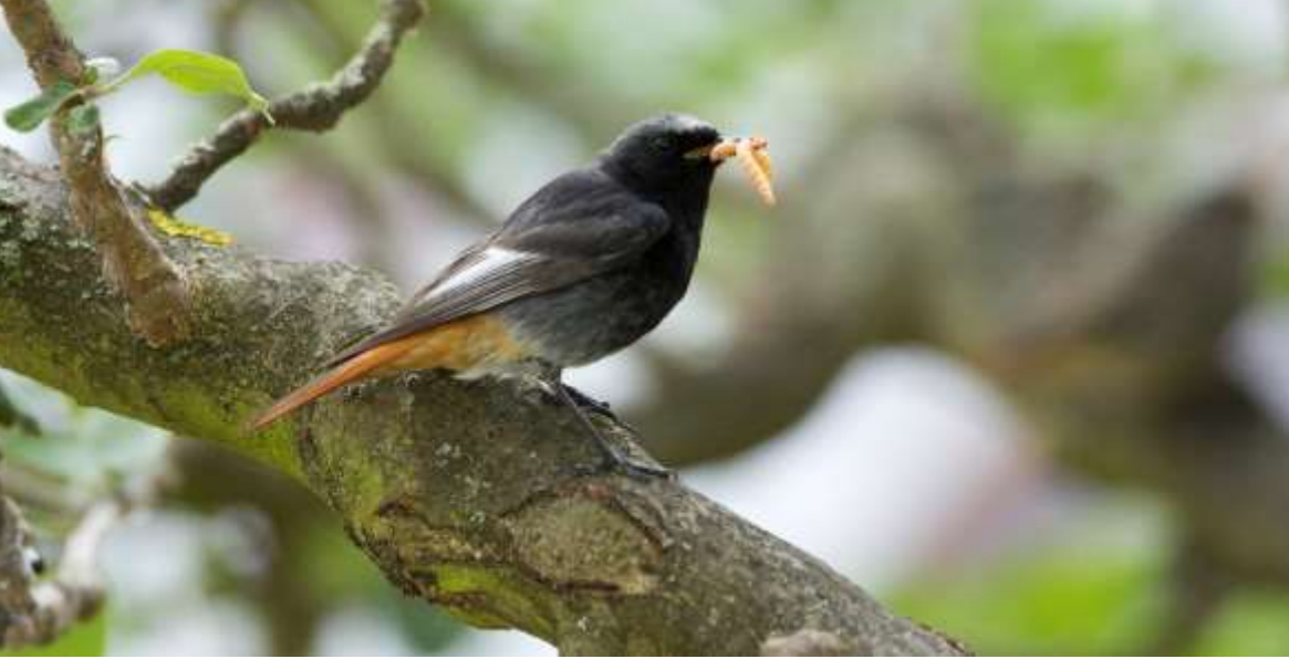
Hausrotschwanz ( Phoenicurus ochruros )