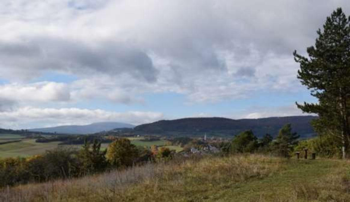
Blick vom Osterberg auf Sondheim und Urspringen