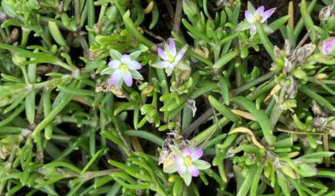
Salz-Schuppenmiere ( Spergularia marina )