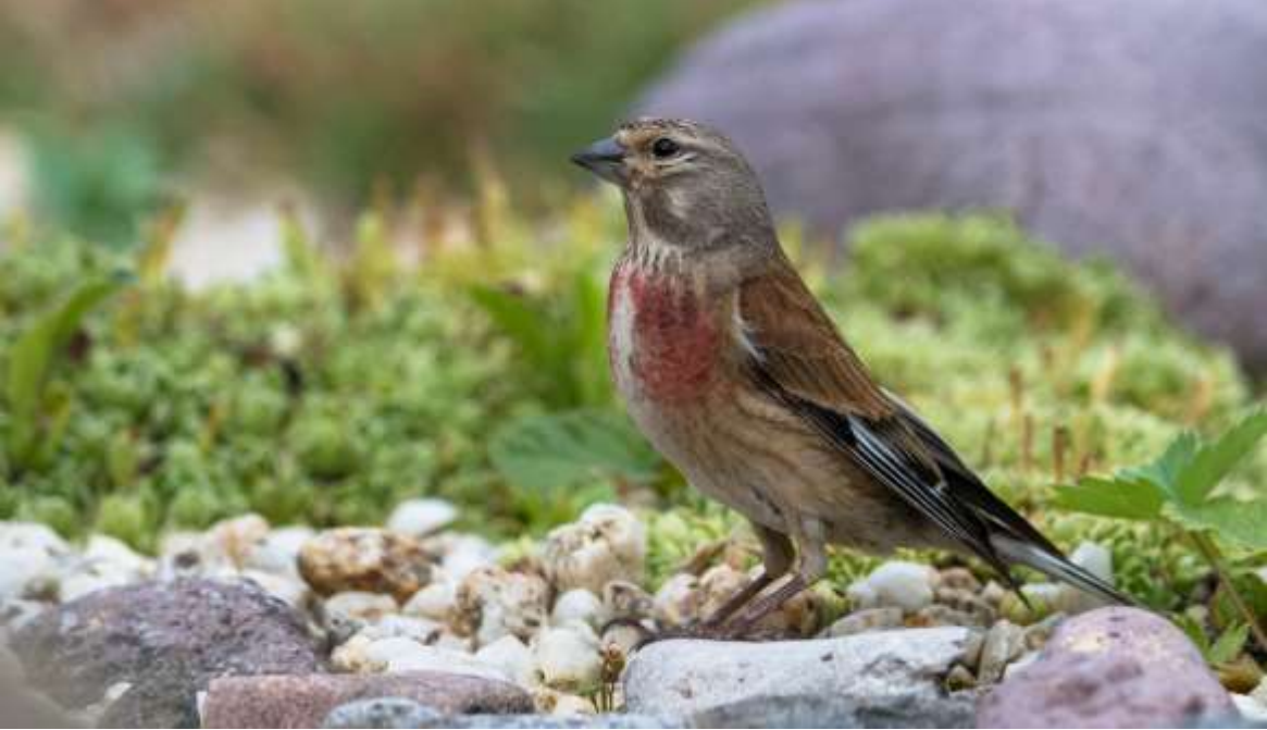
Bluthänfling ( Linaria cannabina )